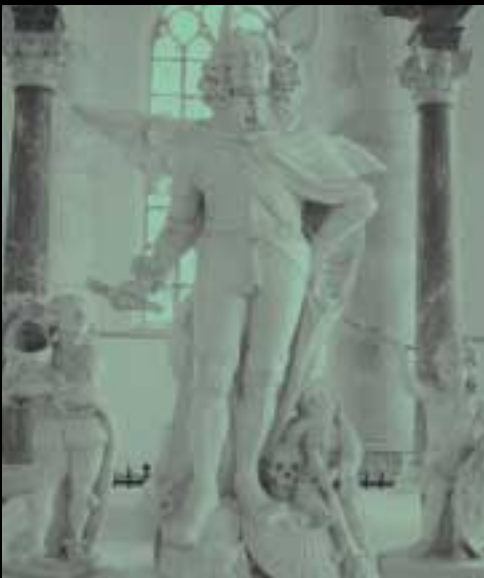
Praalgraf van admiraal Jacob van Wassenaer van Obdam

Jacob van Wassenaer leed toen al aan jicht en was daardoor genoodzaakt zijn vloot zittend op een stoel aan dek aan te voeren. Onder zijn leiding vond in 1656 de vloottocht naar de Oostzee plaats, waar oorlog