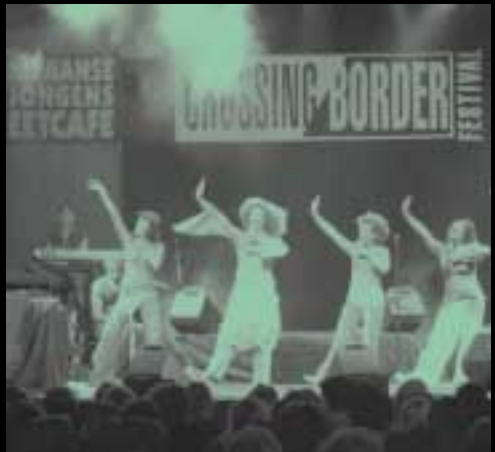
Cultureel evenement het Crossing Border Festival