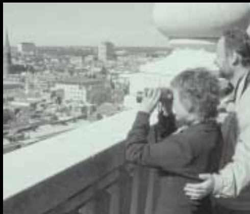
Adembenemend uitzicht op 54 meter hoogte.

Het maximum aantal deelnemers is 25. Daarom is het verstandig groepen van tevoren aan te melden. De prijs is € 2,50. Kinderen en bezitters van de Ooievaarspas betalen € 1,50. Met vakantiepas of kortingsbon voor donateurs € 1,-